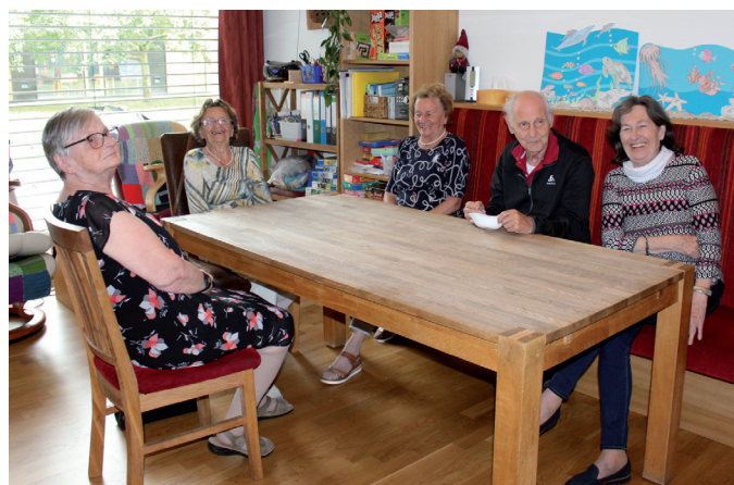
Vergnügliches Beisammensein in der Tagesbetreuung.